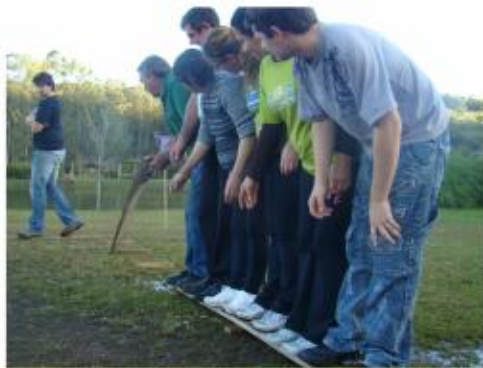
caminho das tábuas