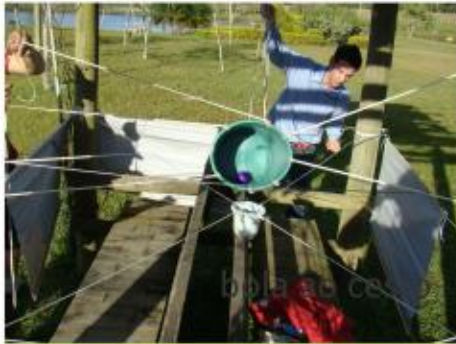
bola ao cesto