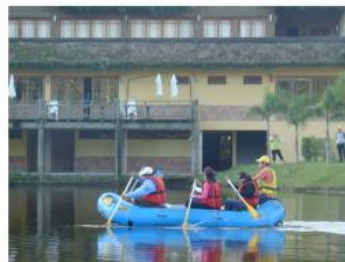
rafting no lago